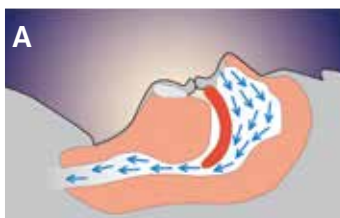
Durante il sonno normale (A)