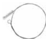
Spazzola per il tubo